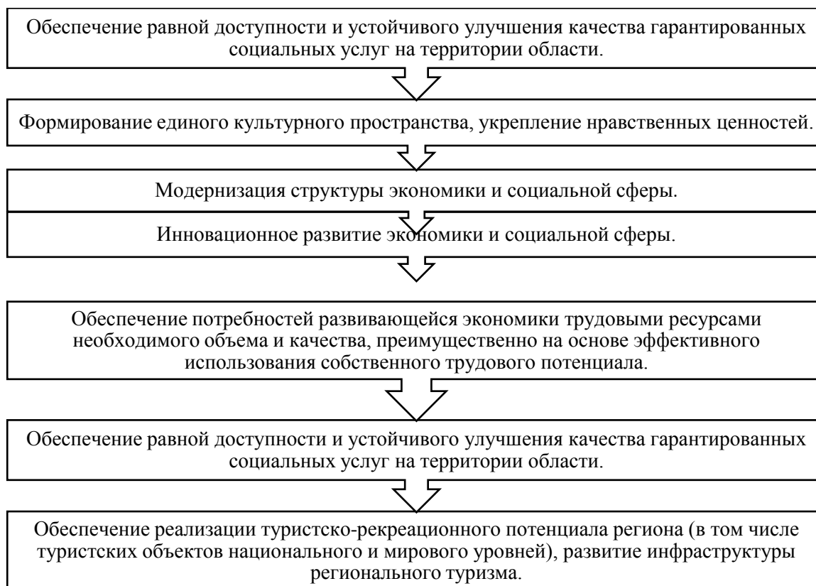
Рисунок 2. Согласованные стратегические цели социально-экономического развития Воронежской области.

развития региона в рамках стратегических задач развития культуры региона в целом, представленные на рисунке 2.