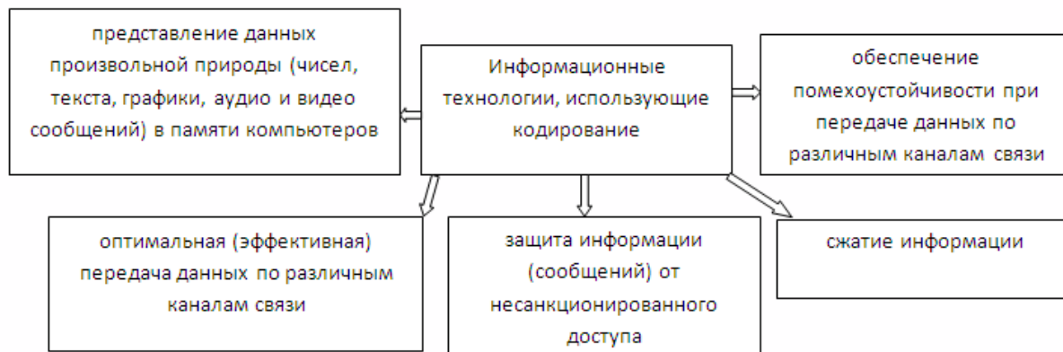
Рисунок 1. Анализ информационных технологий, связанных с кодированием

2. Алгоритм Хаффмена. В нем проводится процесс ранжирования символов. После этого повторяется циклический процесс ранжирования вероятностей тех символов, которые не имеют наименьшие вероятности появления. В результате формируется граф кодирования.